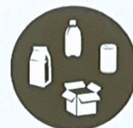
FOOD AND BEVERAGE CONTAINERS